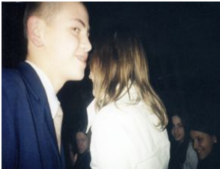
Наші дороги часто розходяться