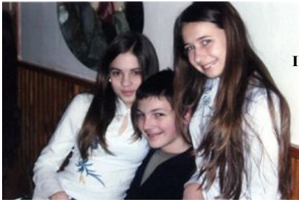
Івасик аж почервонів